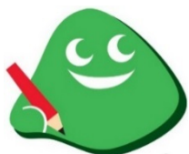
道民カレッジロゴマーク「マナボー」