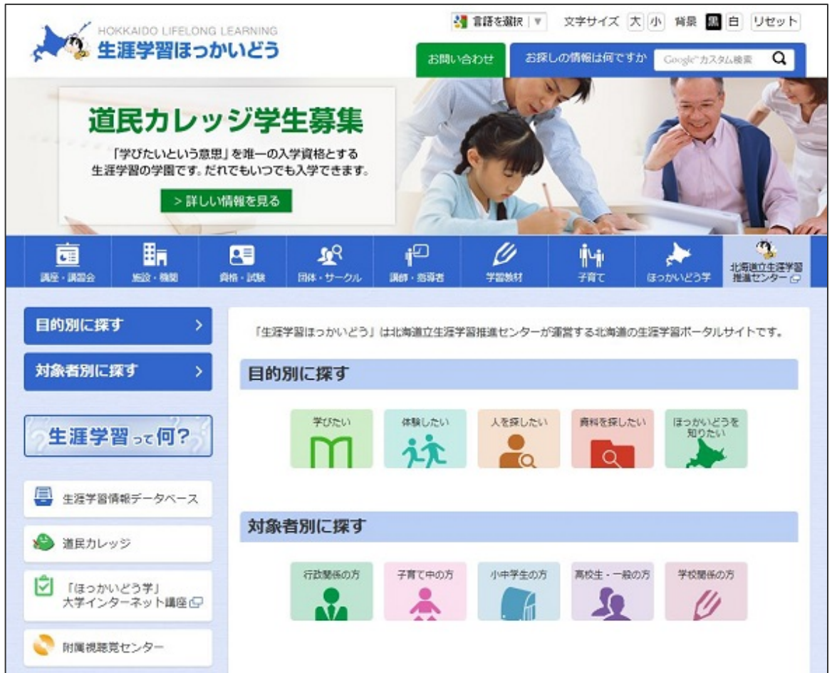
リニューアル後の「生涯学習ほっかいどう」トップページ