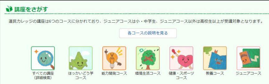
講座の検索画面。これまで以上に、講座を探しやすくなりました!

見やすくなったばかりではなく、利用する道民の皆様の視点で整理し、利便性の向上を図りました。各電子申請については、すでに公開している「道民カレッジ連携講座」の申請に加え、4月以降は視聴覚教材の利用申込みできるようになります。