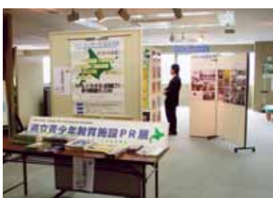
道立青少年教育施設のPR展示