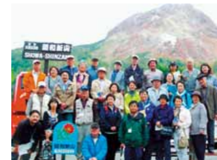
22年10月3日 洞爺湖有珠山ジオパークツアー