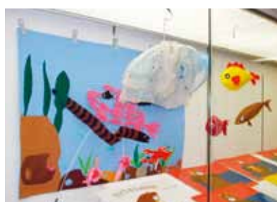
江別市おはなしなあにの作品展示