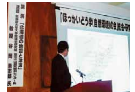
23年6月26日 谷岡勇一郎教授の講演