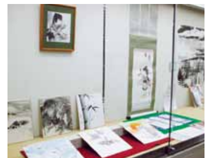
趣墨会の作品展示

情報交流広場は道民のみなさんの学習成果の発表の場です。道民カレッジで学んだことを作品展示などで活かしてみませんか。