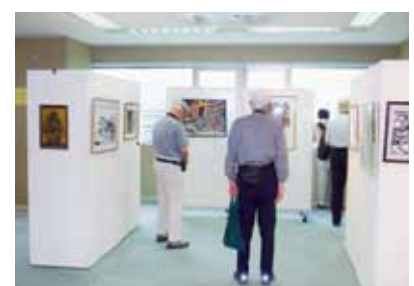
札幌切り絵の会の作品展示