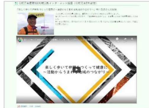
道民カレッジHP (地域活動インターネット講座のページ)