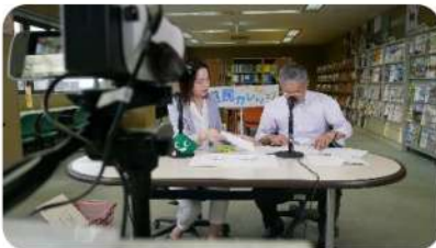
まなびの広場での収録の様子

地域のつながり、人と人のつながりを強く感じる実践事例ですので、是非ご覧ください。