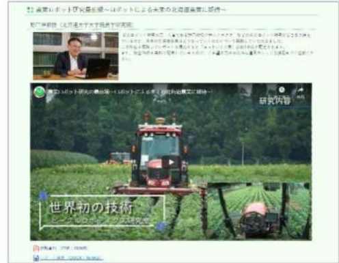
道民カレッジHP (大学インターネット講座のページ)