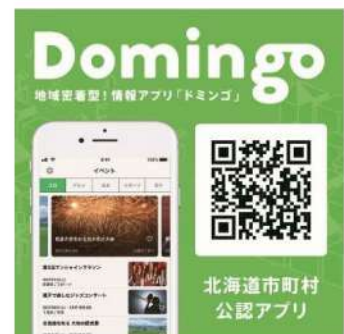
北海道市町村 公認アプリ

8月末から随時連携していきます。スマートフォンをお持ちの方は是非ダウンロードしてみてくださいね。