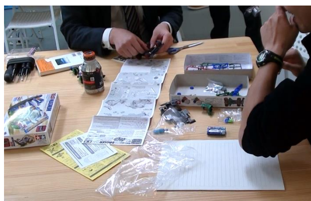
写真 2：ミニ四駆作り